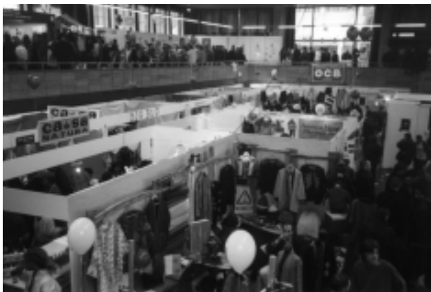
VUE PARTIELLE DU SALON

En 1994, la Cour Constitutionnelle a dépénalisé la possession et la consommation "de petites quantités" de cannabis. Aujourd'hui, on estime que le seul marché d'accessoires représente déjà un chiffre d'affaires annuel de plus de un milliard de francs. Et la re-légalisation de la culture du chanvre à des fins industrielles a donné une véritable impulsion au développement de nouveaux produits.