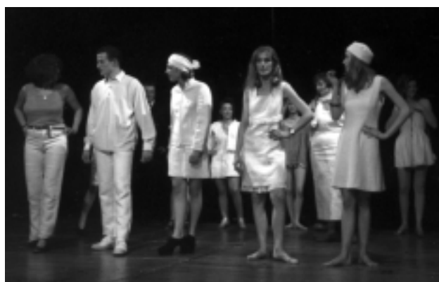
Défilé de mode EN CHANVRE

Cette manifestation a attiré près de 300 personnes. Pour une première, cet événement a été une réussite qui ne demande qu'à être renouvelé !