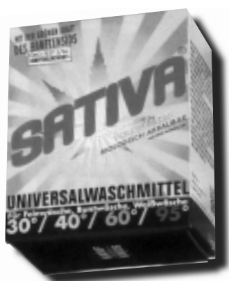
LESSIVE À BASE DE CHANVRE

Du côté des nouveaux produits, on pouvait découvrir de l'ameublement, de la lessive biodégradable, une planche de snowboard et goûter de la liqueur, du soda et de la bière de chanvre ! Ce nouveau breuvage - de même composition qu'une bière classique à laquelle on ajoute des fleurs de chanvre - a d'abord été brassé par les suisses, sous la marque Hanf . Aujourd'hui, les allemands produisent également une bière, dénommée Cannabia .