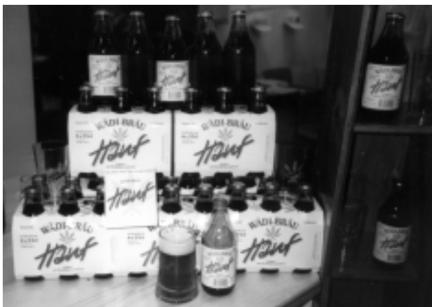
LA BIÈRE HANF, DISTRIBUÉE PAR DER.GASTRO.PARTNER. (VOIR CANNAPUBS)

Du côté des nouveaux produits, on pouvait découvrir de l'ameublement, de la lessive biodégradable, une planche de snowboard et goûter de la liqueur, du soda et de la bière de chanvre ! Ce nouveau breuvage - de même composition qu'une bière classique à laquelle on ajoute des fleurs de chanvre - a d'abord été brassé par les suisses, sous la marque Hanf . Aujourd'hui, les allemands produisent également une bière, dénommée Cannabia .