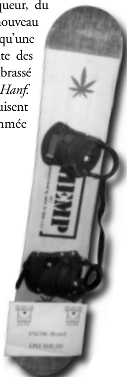
PLANCHE DE SNOWBOARD